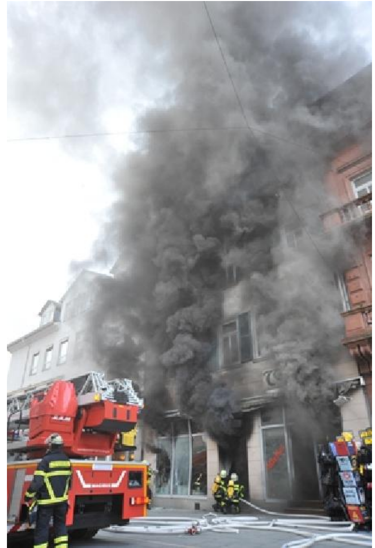
Brand eines Ladengeschäftes in der Louisenstraße Am 01.03.2010